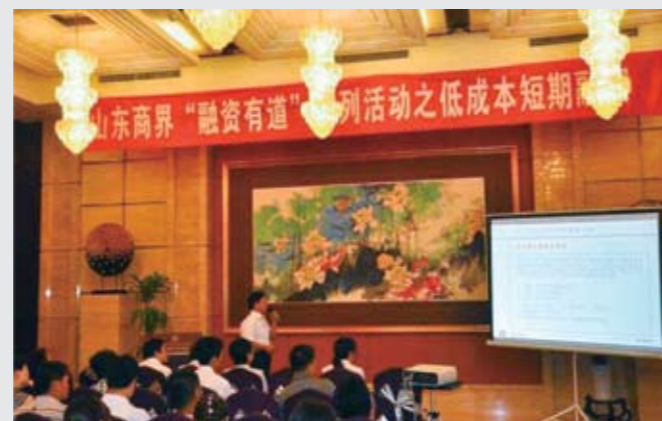
国信典当成功举办“融资有道——低成本短期融资”活动