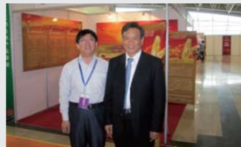
省金融办李永健主任莅临公司展位指导——国信典当参加“2011中国（济南）国际金融博览会”